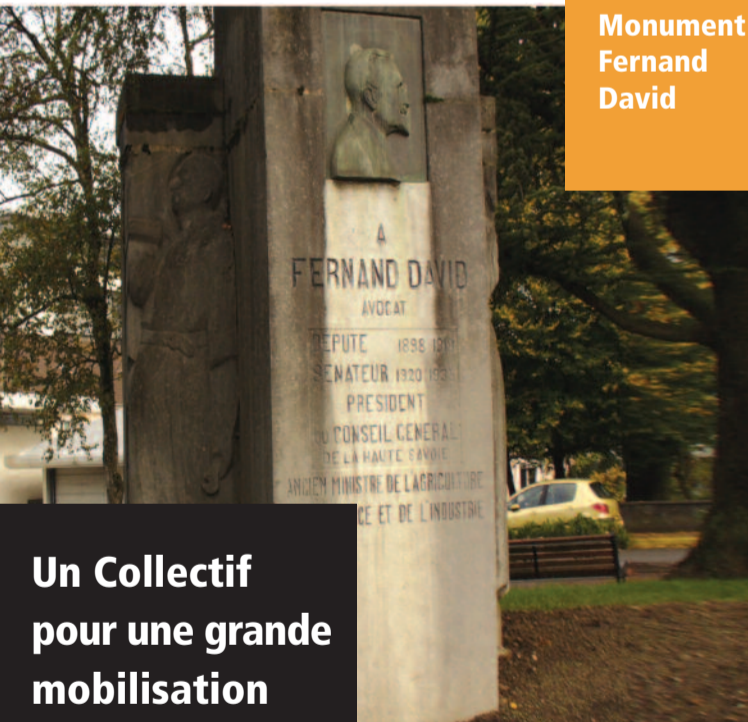
Monument Fernand David

Depuis des années, plusieurs associations œuvrent localement sur le terrain pour la préservation du patrimoine de la commune. Trois d'entre elles, représentant près de mille adhérents , ont décidé de créer un Collectif afin de donner une dimension inédite à la défense du patrimoine local.