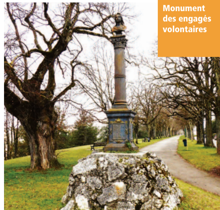
Monument des engagés volontaires

Créée en 2014, l'association compte 114 adhérents. Sa principale mission est de sensibiliser les habitants de St-Julien à la valeur historique, culturelle, artistique et naturelle du patrimoine de la ville.