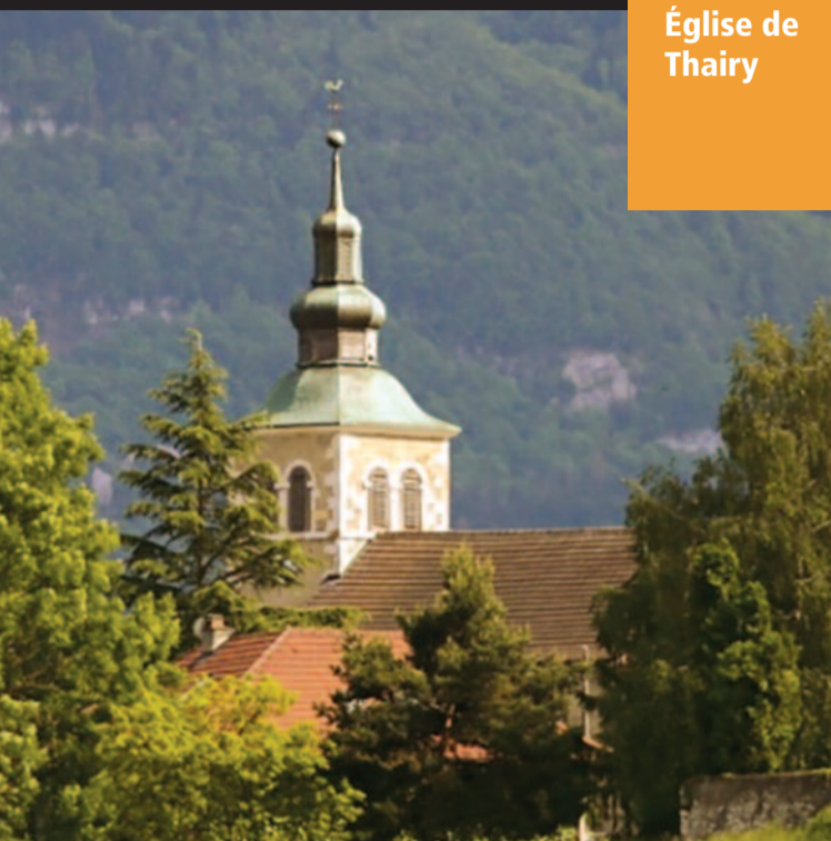
Église de Thairy